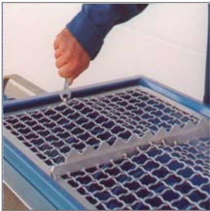
Integrierter Sackaufreißer auf dem Sieb