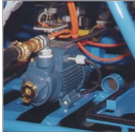
Wasserdruckerhöhungspumpe Zur Befestigung am Maschinenrahmen.