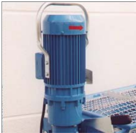
Leichter und kleiner 5,5 kW Pumpenmotor mit Schutzbügel.