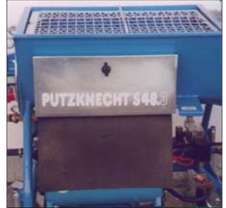
Leicht zugänglicher Werkzeugkasten: Platz für Bordwerkzeug und kleineres Zubehör.