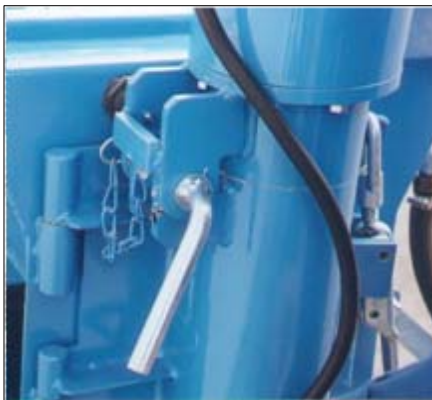
Pumpenmotor ohne Werkzeug zum Transport leicht abnehmbar.

Einblashaube mit Mono-Filter und Füllstandsonde für die pneumatische und automatische Beschickung durch den Putzknecht P330 mit Material aus Silos oder Containern. >