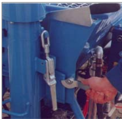
Leicht nach spannbarer Keilverschluss zum Schließen der Mischkammer

Neben den bewährten Merkmalen, wie leichte, aber robuste Bauweise, einfache Handhabung, außergewöhnliche Zuverlässigkeit und Servicefreundlichkeit, haben unsere Ingenieure Erkenntnisse aus der Praxis und wertvolle Anregung unserer Kunden aufgenommen.