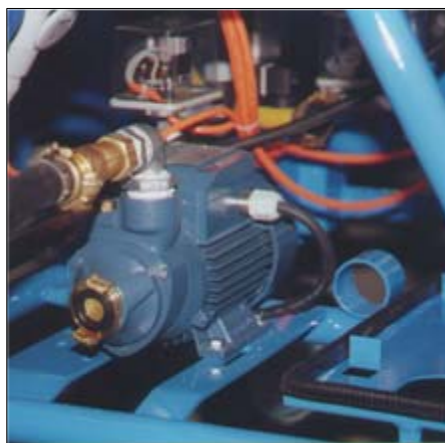
Druckerhöhungspumpe mit automatischer Abschaltung während Arbeitspausen.

für den klassischen Stuckateur-Betrieb, aber auch für den Beton Sanierer und Renovierer,