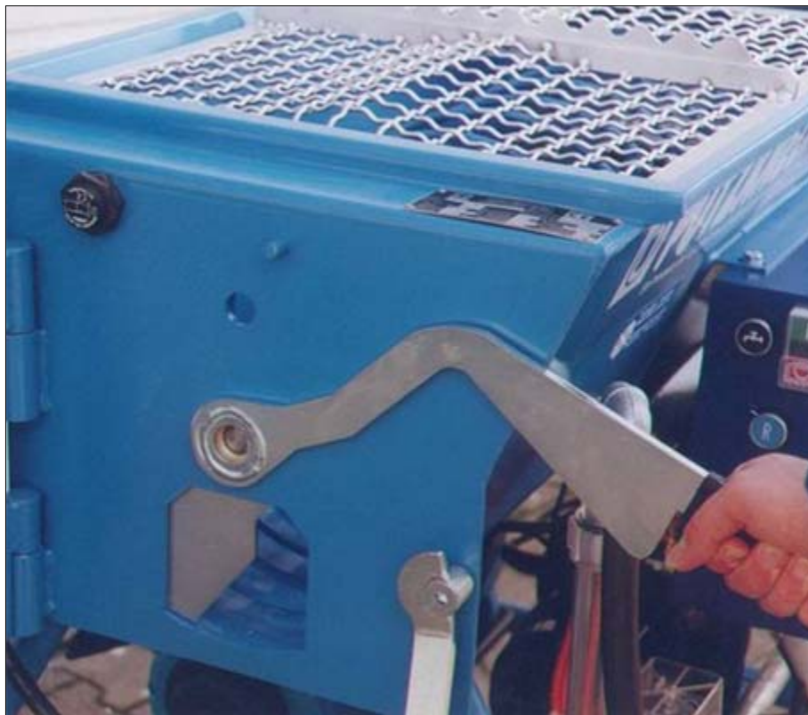
Verbesserter Schieber zwischen Trockenbehälter und Mischkammer. Voll geladen mit trocken Material kann die Arbeit unterbrochen werden.

Eine Vielfalt sinnvollen Zubehörs, wie verschiedene Spritz- und Zierputzgeräte, Verpressdüsen, Zargenhinterfüllpistolen, Nassmörtel-Nachmischer, Pumpeneinsätze mit verschiedenen Förderleistungen machen den Putzknecht S48.3 zu einer der vielseitigsten Verarbeitungsmaschinen: