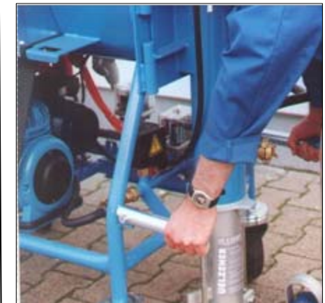
4 Praktische Tragegriffe erleichtern den Transport der Maschine