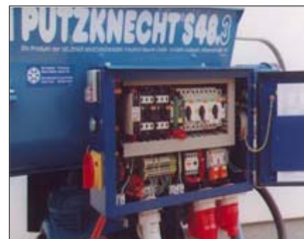
Verbesserte elektrische Steuerung mit Drehrichtungsautomatik und Wiedereinschaltsperre

den Fliesenleger, Fließestrichleger und Sonderanwender.